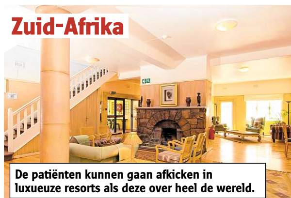
De patiënten kunnen gaan afkicken in luxueuze resorts als deze over heel de wereld.

Zijn de patiënten terug, dan krijgen ze drie maanden nabehandeling. Twee keer per week. Vereecke: 'En we hameren er op dat ze naar de AA moeten. Dat zo'n vereniging belangrijk blijft. Iets wat ze nooit wilden