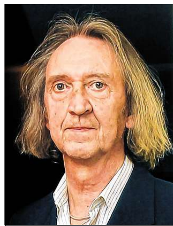
Noël na de drank: 'Ik heb het stressvolle leven als accountant vaarwel gezegd. Ik liet mijn haar groeien, draag nooit meer een maatpak en geniet van de kleine dingen.'

Het begon op zijn dertigste en dat ging zo door tot zijn vijftigste. 'Ik had geen last van katers. Maar ik had wel telkens meer drank nodig om hetzelfde effect te krijgen. Door de drank kon ik bergen werk verzetten. Sociale controle was er niet, ik was mijn eigen baas.' Tot op een ochtend een folder van een ontwenningkliniek op zijn